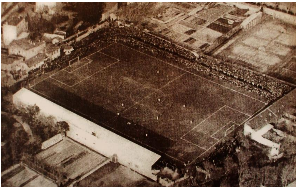
Le stade de l’Huveaune pendant un match, date non citée (ECHINARD/PÉCHERAL, 1998)

Les reportages de football laissent augurer la valorisation et l’acceptation du championnat national et évoquent une fierté du fait que Marseille est le lieu organisateur d’un match de la Coupe. Les prix d’entrée étaient plus élevés et une “ tribune d’honneur ” avait été mise en place. Ensuite la désignation des “ supporters cettois ” apparaissait, qui se référait à un nouveau groupe de personnes, qui ne venait pas seulement regarder le match, mais qui participait activement au spectacle et leur arrivée exigeait des moyens de transport supplémentaires. En outre les reportages sont truffés d’anglicismes comme “ sportsmen ”, “ goal ”, “ ground ”, “ corner ”, “ team ”, “ leader ”, “ penalty ”, etc., qui constituaient le vocabulaire du jargon de football.